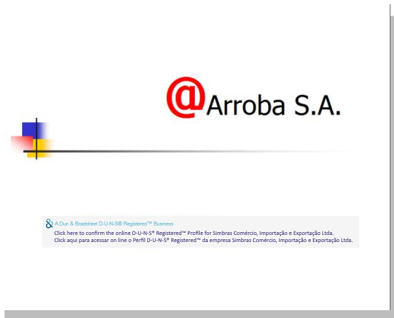
MODELO APRESENTAÇÃO EM POWERPOINT

Click aqui para acessar on line o Perfil D-U-N-S® Registered™ da empresa Simbras Comércio, Importação e Exportação Ltda.